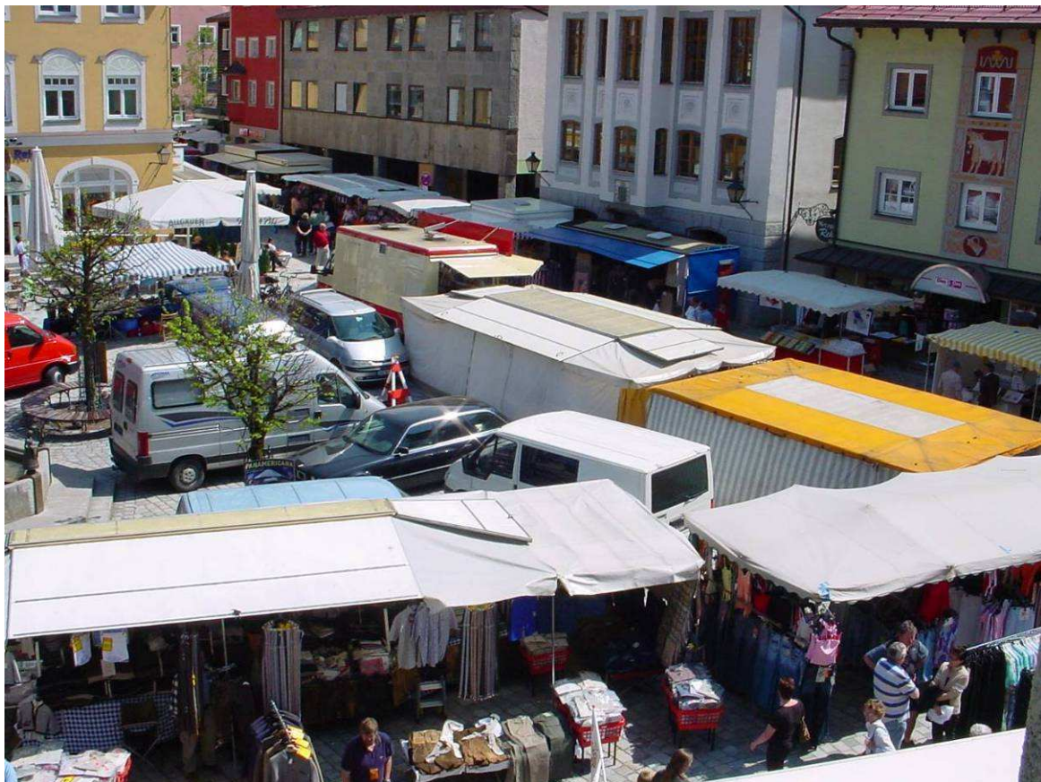
Bild: Ortsüblicher Straßenmarkt auf Plätzen und in Straßen