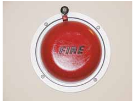
Abb. 9 Alarmglocke

Als sehr gute Lösung ist der Hausalarm zu betrachten. Hier wird über eine festinstallierte Alarmierungseinrichtung mit optischen und akustischen Warneinrichtungen die Notsituation weiträumig angezeigt. Die Auslösung kann dabei automatisch über Rauchmelder und/oder über Druckknopfmelder erfolgen. Bei großen und/oder mehrgeschossigen Einrichtungen sollte diese Lösung bevorzugt Anwendung finden. Die Alarmierung kann auch drahtlos über Funk erfolgen, was die Nachrüstung in bestehenden Einrichtungen wesentlich erleichtert.