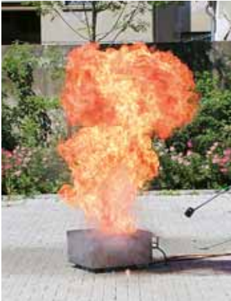
Abb. 2 Fettexplosion

Einen besonders drastischen löschtechnischen Fehler zeigt die Abbildung 2. Gerade im Bereich von Küchen, in dem mit heißen Fetten oder Ölen gearbeitet wird, kann der Einsatz des falschen Löschmittels (Wasser) hier zu einer erheblichen Brandausbreitung führen. In diesem Fall kommt es zur sogenannten Fettexplosion, welche meterhohe Stichflammen und somit eine schlagartige Brandausbreitung zur Folge hat und zu schweren Verletzungen bei Personen führen kann.