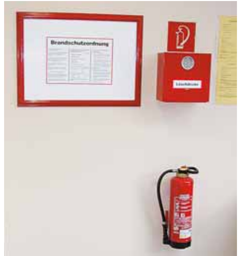
Abb. 10 Feuerlöschmittel

Zu berücksichtigen ist auch das Gewicht der Feuerlöscher. Besser ist es, mehrere kleinere, leicht handhabbare als wenige große und schwere Löscher bereitzuhalten. Dies gewährleistet den Einsatz auch durch kleinere Personen (Personal). In einer Einrichtung ist es sinnvoll, nur Feuerlöscher gleicher Bauart der Auslöse- und Unterbrechungseinrichtung anzubringen. Dauerdrucklöscher sind nicht zu empfehlen, besser sind hier so genannte Aufladelöscher. Der Umgang mit Feuerlöschern sollte praktisch geübt werden, um die Scheu vor einem im Notfall notwendigen Einsatz abzubauen. Entsprechende Seminare, in denen der Umgang mit Feuerlöschern praktisch geübt wird, werden u. a. von der Unfallkasse Nordrhein-Westfalen angeboten.