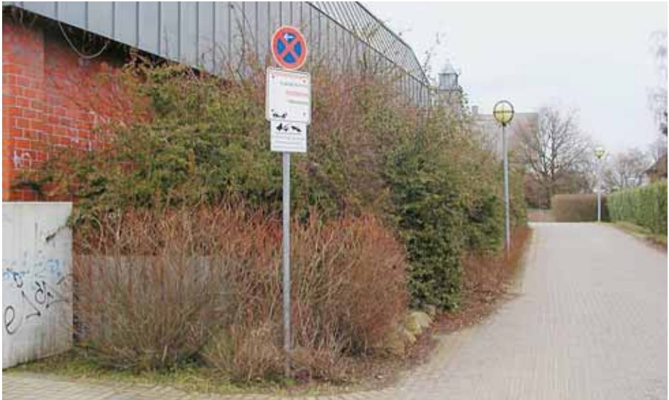
Abb. 3 Feuerwehrzufahrt