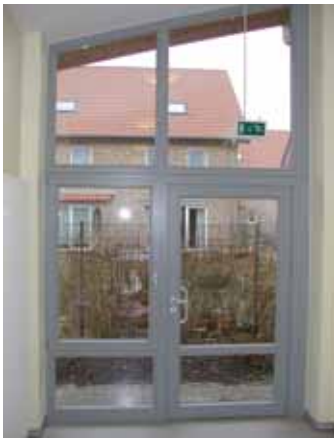
Abb. 4 Notausgang

Bei Kindertageseinrichtungen mit Geschossen über und/oder unter Erdgleiche sollte ein zweiter baulicher Flucht- und Rettungsweg vorgesehen werden.