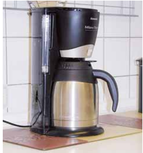
Abb. 7 Brandfeste Unterlage

Grundsätzlich sind keine Mehrfachsteckerleisten in Bereichen zu positionieren, in denen sie mit Wasser in Kontakt kommen können, z. B. direkt neben Aquarien oder Spülbecken. Die Verwendung von Kreuzsteckern ist zu unterlassen. Elektrogeräte, die eine hohe Temperatur erzeugen, wie z. B. Wasserkocher oder Toaster, sollten nur auf einer nichtbrennbaren Unterlage, z. B. einer Fliese, aufgestellt und betrieben werden. Dadurch wird bei einem möglichen Defekt des Gerätes ein Entstehungsbrand verhindert.