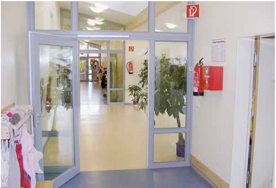
Abb. 8 Rauchmeldergesteuerte Rauchschutztür

bieten sich hier Kleidungsstücke aus Naturfasern wie Baum- oder Schurwolle an, welche wesentlich schwerer entflammbar sind als Kunstfasern. [18]