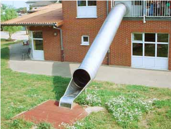
Abb. 6 Fluchtrutsche

Kinder keine unbekannte oder befremdliche Situation. Das Rutschen gehört dann in einer Notsituation zu einem geübten Vorgang. Über diese Fluchtrutschen kann eine schnelle und sichere Räumung erfolgen und birgt nicht die Gefahr, dass aufgrund eines Sturzes die Räumung ins Stocken gerät. Die Betreuer sollten jedoch den Kindern beim Absteigen von der Rutsche Hilfestellung leisten, damit am unteren Ende der Rutsche alles reibungslos verläuft. Somit ist auch die schnelle Evakuierung von Kleinstkindern möglich, sodass das Personal eine langwierige und anstrengende Evakuierung über die Treppe erspart bleibt. Als sehr vorteilhaft hat sich hier auch eine Kombination aus Treppe und Rutsche erwiesen.