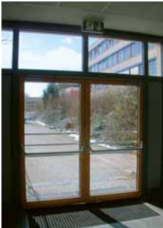
Abb. 5 Notausgang

gesicherten Bereich führt, ermöglicht werden. Als Alternative zur Nottreppe ist bei Obergeschossen auch eine Fluchtrutsche verwendbar. gesicherten Bereich führt, ermöglicht werden. Als Alternative zur Nottreppe ist bei Obergeschossen auch eine Fluchtrutsche verwendbar.